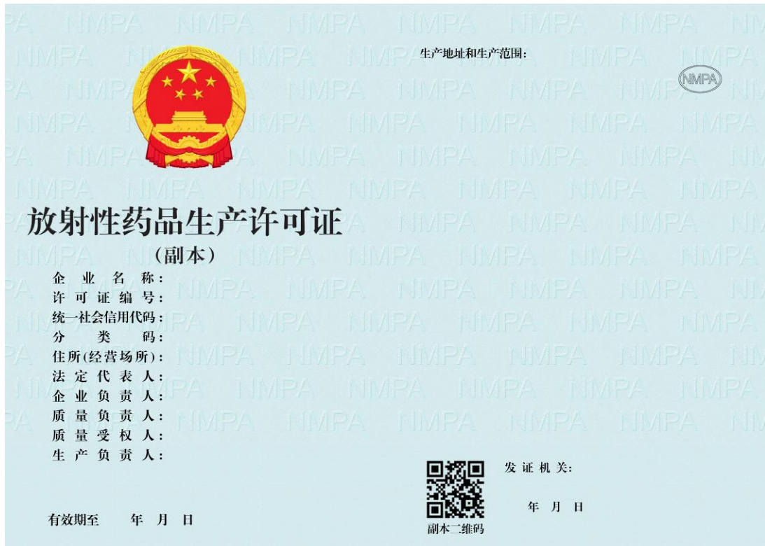
《放射性药品生产许可证》样式（副本）