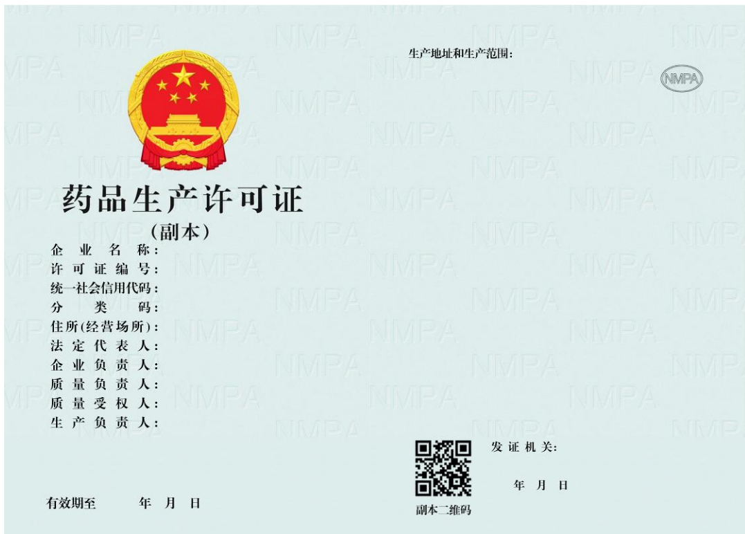
《药品生产许可证》样式（副本）